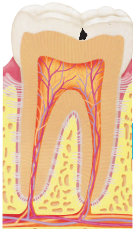
DENTE COM PRINCÍPIO DE CÁRIE NO ESMALTE