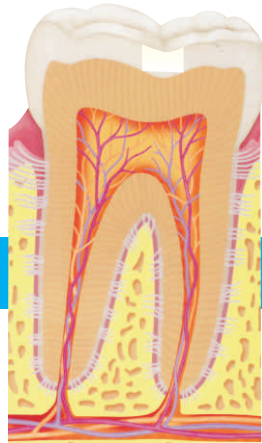
CÁRIE REMOVIDA E DENTE RESTAURADO