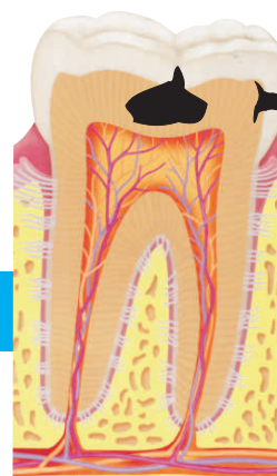
DENTE COM CÁRIE PROFUNDA EM ESMALTE E DENTINA