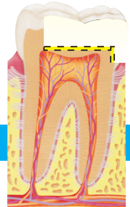
CÁRIE REMOVIDA, POLPA PROTEGIDA E DENTE RESTAURADO NAS DUAS FACES